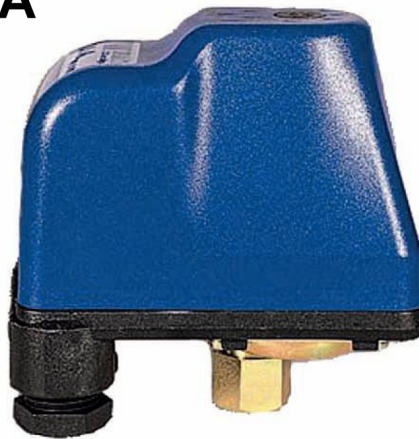
Реле давления РА 5 MI